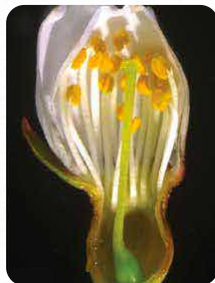
Corte transversal Botón Blanco