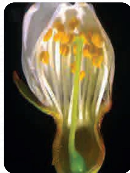
Corte transversal Botón Blanco